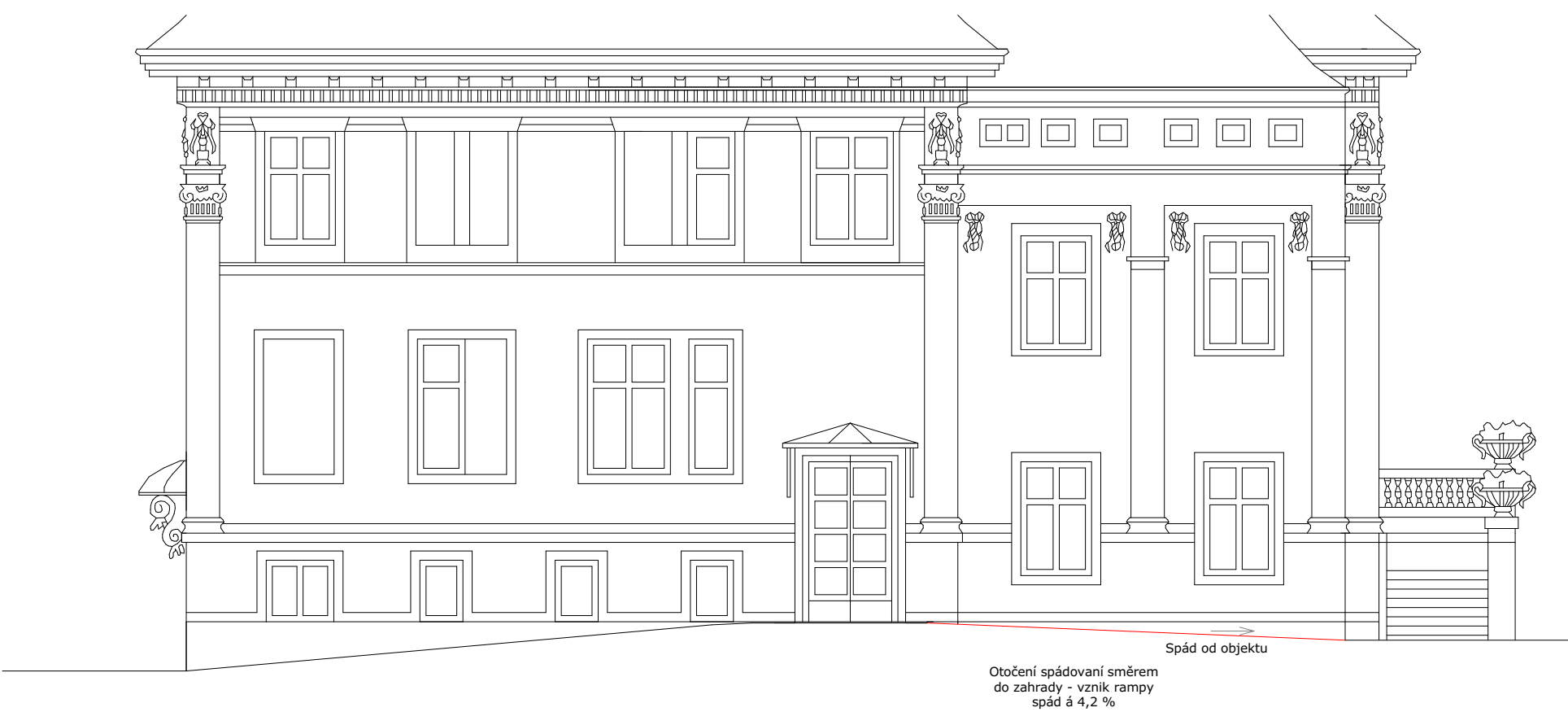
POHLED JIHOZÁPAD - NOVÝ STAV